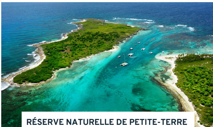
RÉSERVE NATURELLE DE PETITE-TERRE

Selon votre horaire de vol, accueil des voyageurs à l'aéroport de Pointe-à-Pitre avec notre chauffeur. Transfert vers la marina de Saint-François . À 16 h, rencontre entre voyageurs et équipage et installation à bord de notre catamaran ! Nous quittons le port de plaisance pour nous installer, à deux pas de là, dans le lagon de Saint-François, étendue d'eau fermée par la barrière de corail et endroit paisible pour s'acclimater à la vie à bord d'un catamaran. Première baignade possible dans une mer calme ! Souper et nuit à bord.