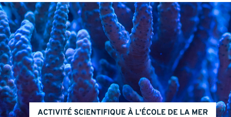
ACTIVITÉ SCIENTIFIQUE À L'ÉCOLE DE LA MER