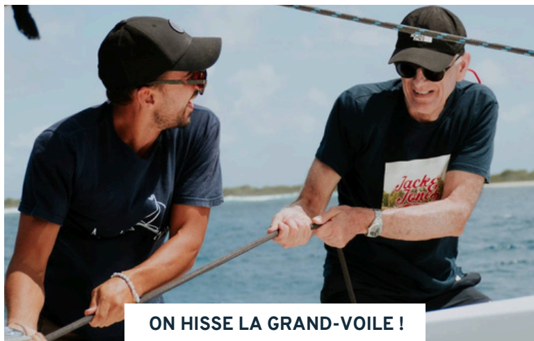
ON HISSE LA GRAND-VOILE !