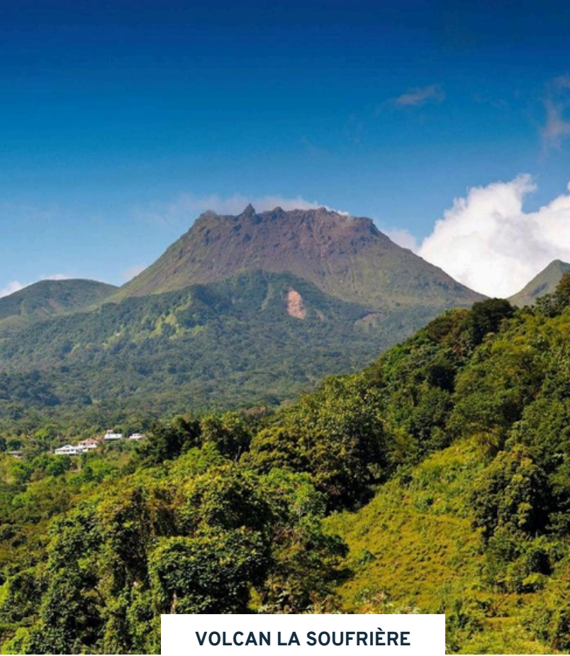
VOLCAN LA SOUFRIÈRE