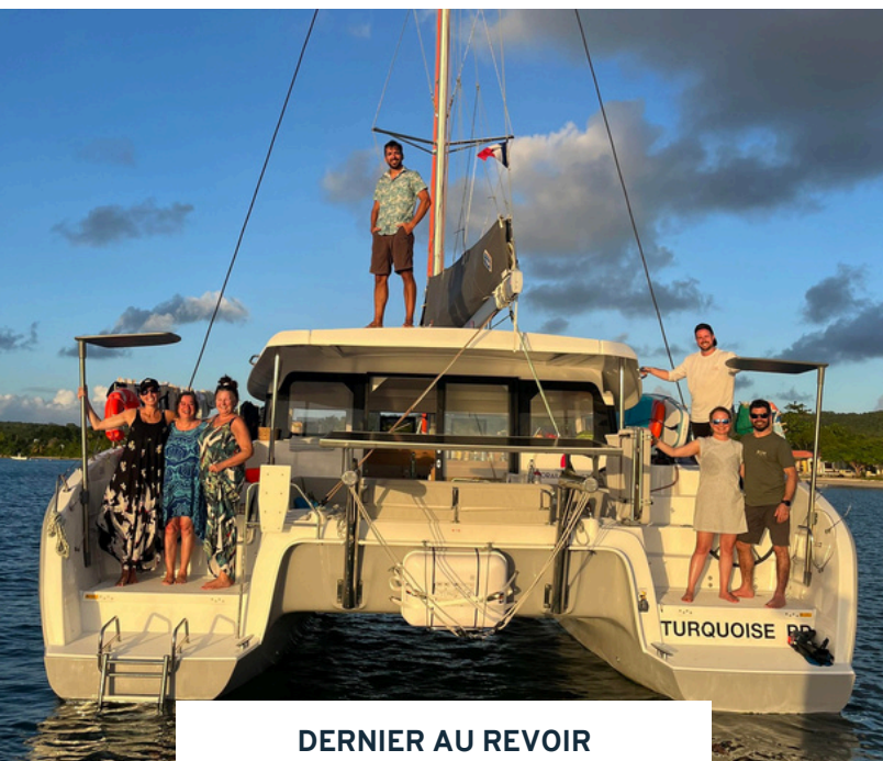
DERNIER AU REVOIR