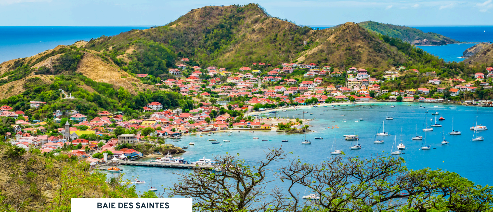
BAIE DES SAINTES