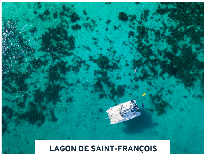
LAGON DE SAINT-FRANÇOIS