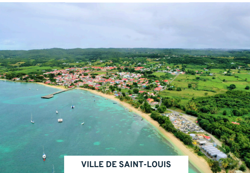
VILLE DE SAINT-LOUIS