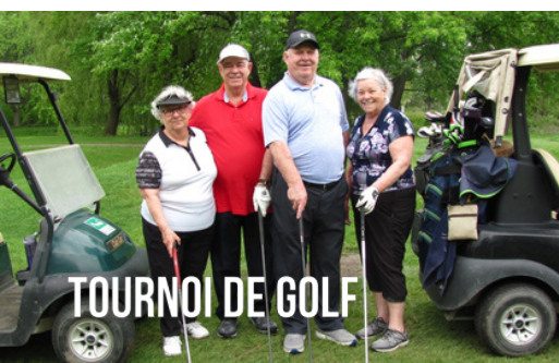
TOURNOI DE GOLF