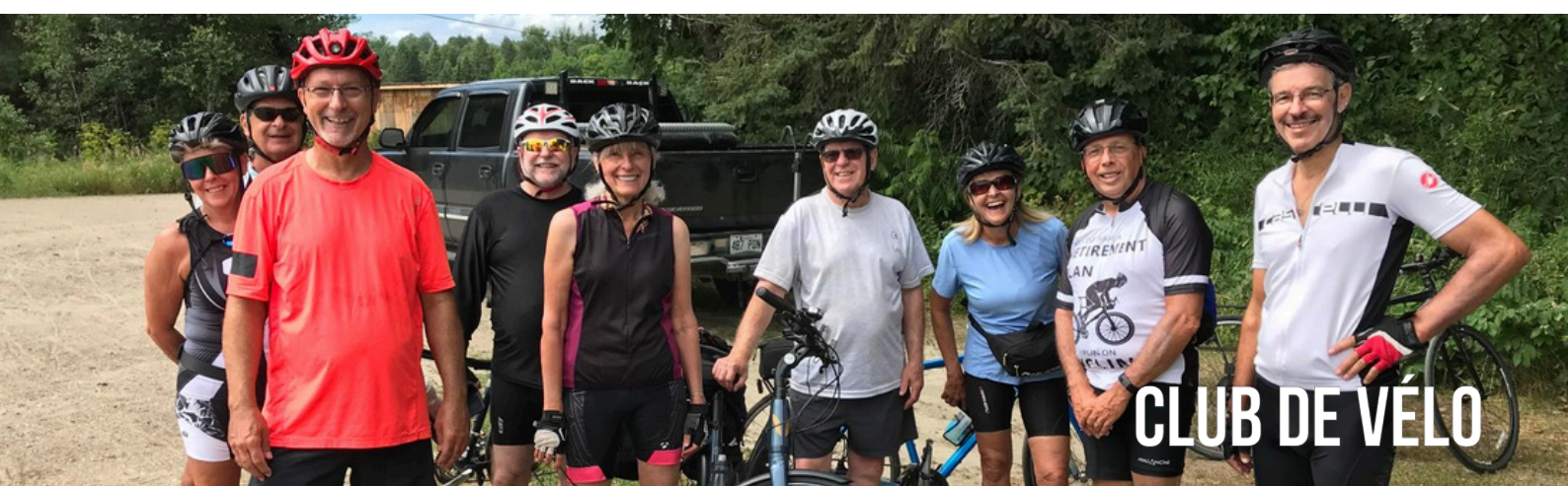
CLUB DE VÉLO