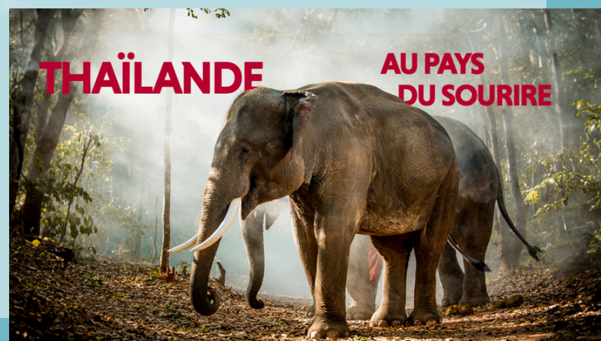
Lyne Lefort Disponible à l'année