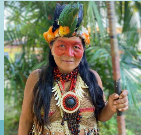
Trésors de l'Équateur et Galapagos Charles Domingue