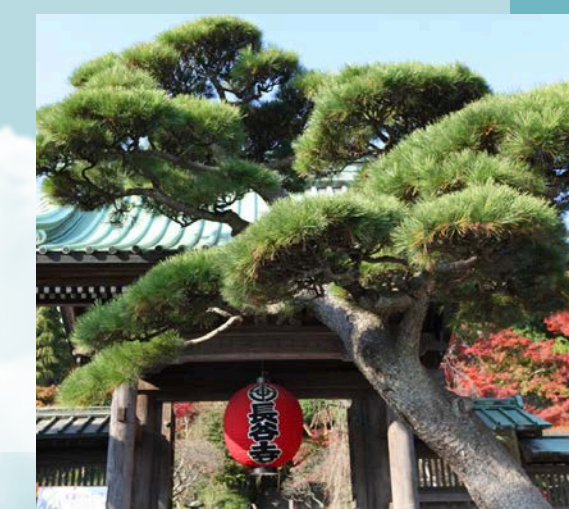
Japon, sur la route des festivités Ugo Monticone