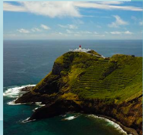
Les Açores, sous le charme Lyne Lefort