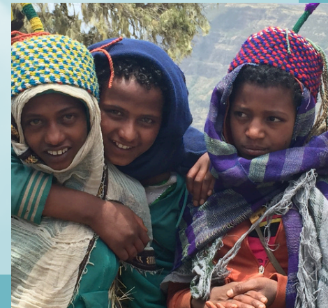
Éthiopie, le pays où l'on a arrêté l'horloge Charles Domingue