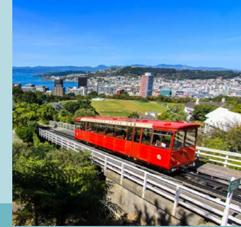
Nouvelle-Zélande, au rythme de la nature Bertrand Lemeunier