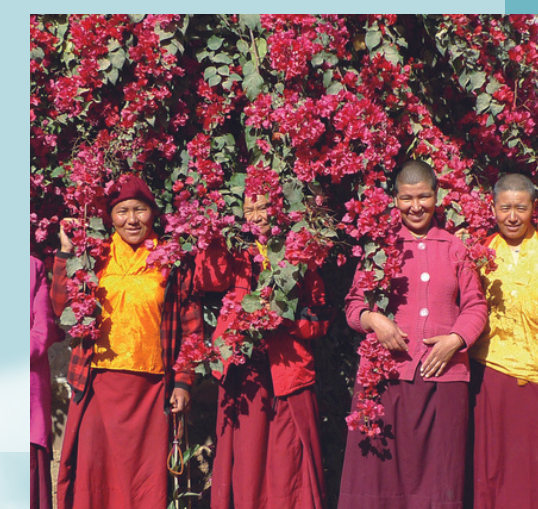
L'Inde en deux dimensions Ugo Monticone