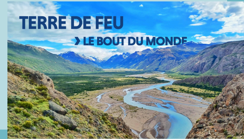
Ugo Monticone Disponible à l'année