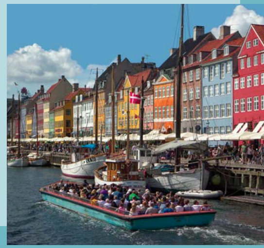
Copenhague - Capitale du bonheur Julie Corbeil